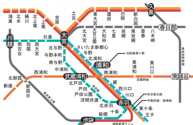
浦和駅周辺路線図