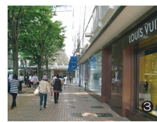
伊勢丹の前を通過