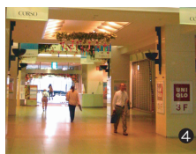
コルソ 1F 通路