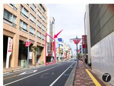
大和証券の隣です