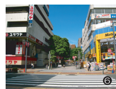
横断歩道をわたって右折