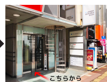
ガラス扉からどうぞ